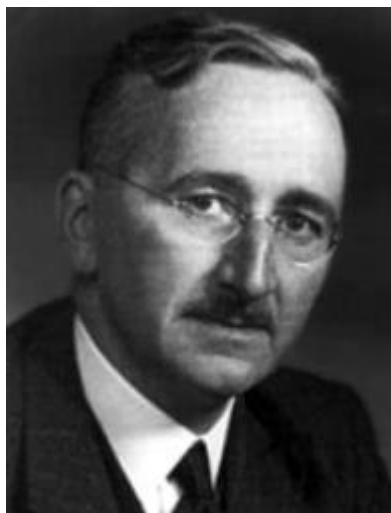
フリードリッヒ・ハイエク

アメリカン・スタンダードではなく、東洋の思想、イスラムの思想等々、地域別の思想や考え方は尊重されなければなりません。