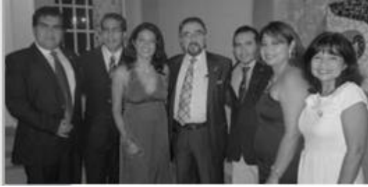
ガラパゴス諸島のロータリアン